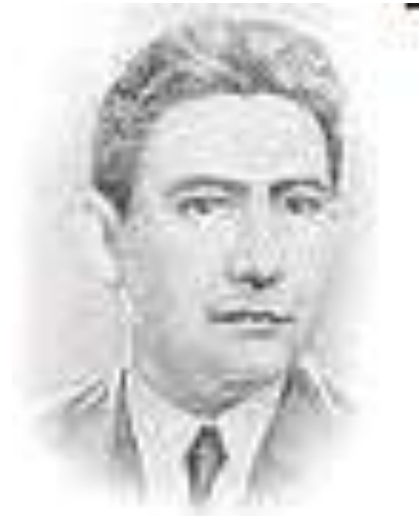
Jesús Enrique Lossada

Para 1.965 se constituye en Distrito con autonomía propia, separándose de Maracaibo; para 1.988, con la nueva división político territorial, se le da su denominación actual Municipio Jesús Enrique Lossada.