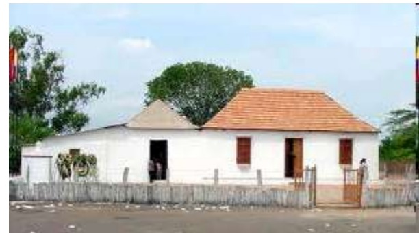
Casa donde vivió el General Rafael Urdaneta