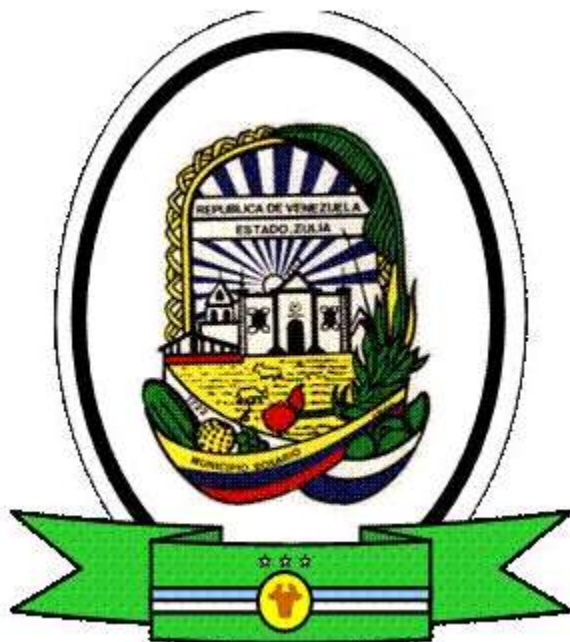
ESCUDO DE ARMAS DEL MUNICIPIO ROSARIO DE PERIJA